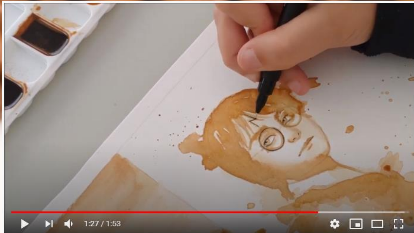
Pintura café com nanquim - Personagem de filme

https://www.youtube.com/watch?v=qOvVJczYJTM&feature=youtu.be