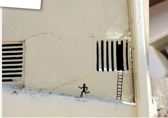
Fra.Biancoshock aposta em ideias simples para chamar a atenção das pessoas para situações que passariam despercebidas (Foto: Fra.Biancoshock)

Aqui o artista colocou objetos que geralmente são colocados em homenagens funerárias (uma "foto", flores, velas...). Tudo isso também não é permanente, pode ser desfeito, é um tipo de arte efêmera.