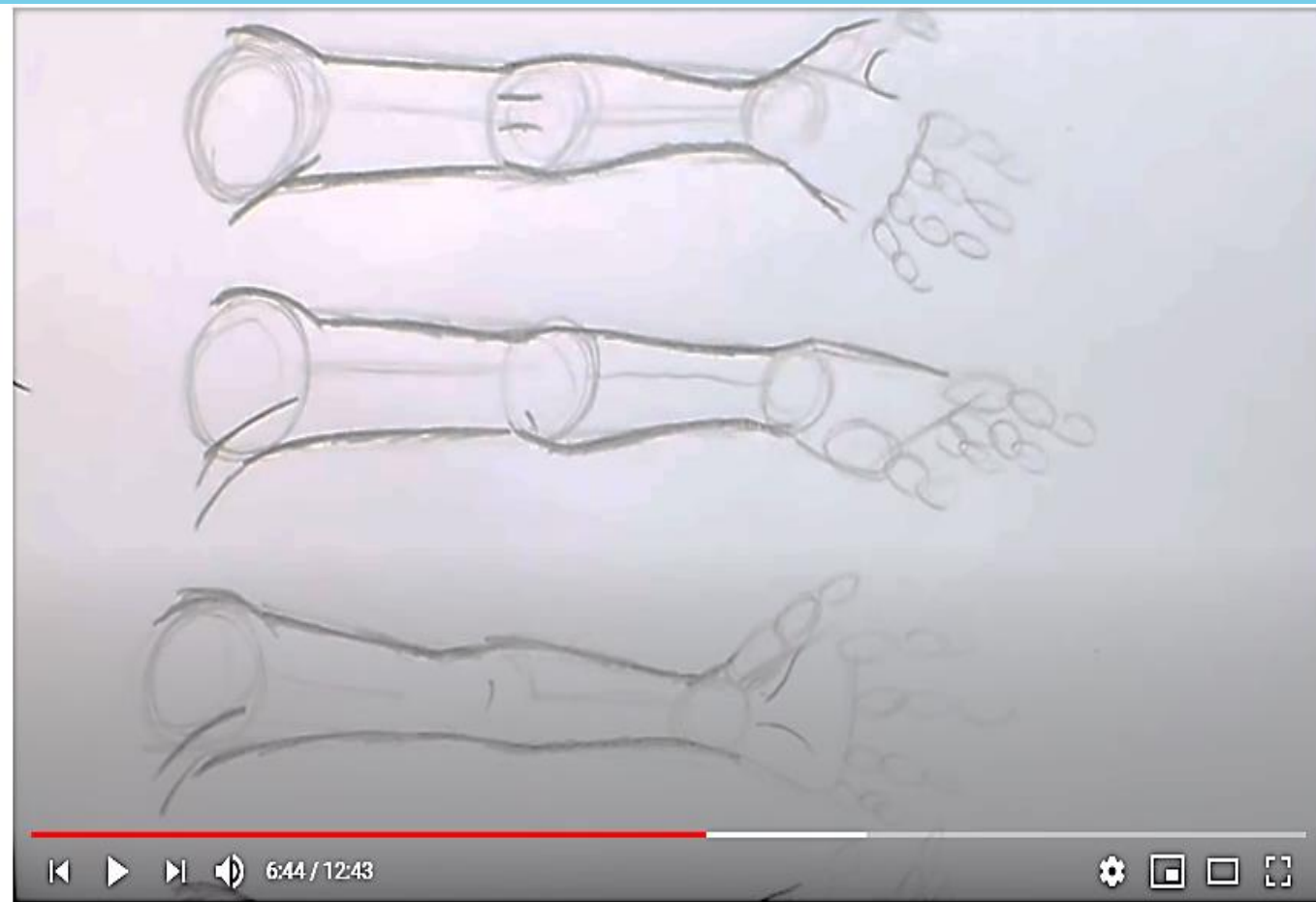
Como Desenhar Mangá - Braços

https://www.youtube.com/watch?v=ZP4K3StHh28