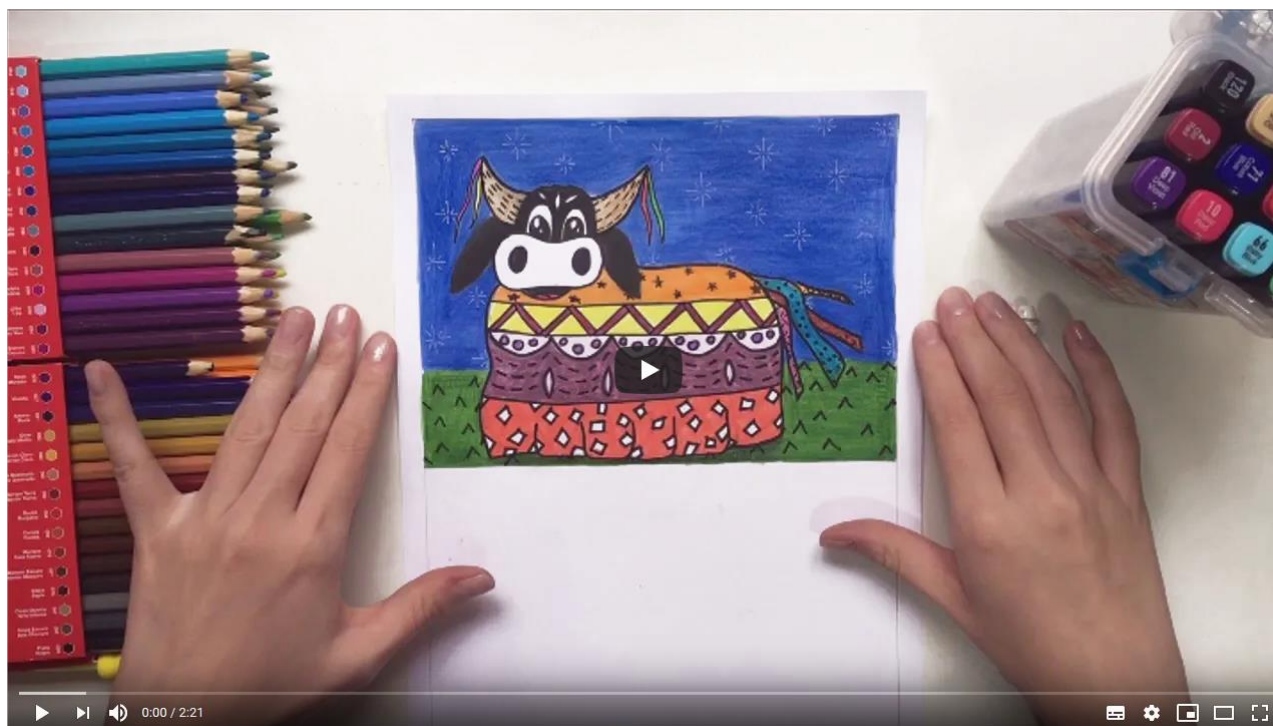
Pintura do personagem folclórico - texturas gráficas

Assista ao vídeo abaixo e veja como fiz minha atividade.