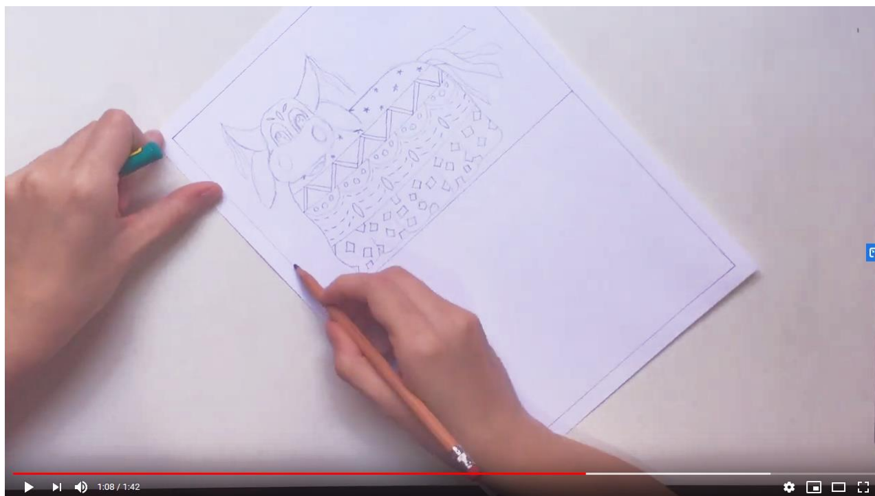
Texturas gráficas - personagem folclórico

Assista ao vídeo abaixo e veja como fiz minha atividade.