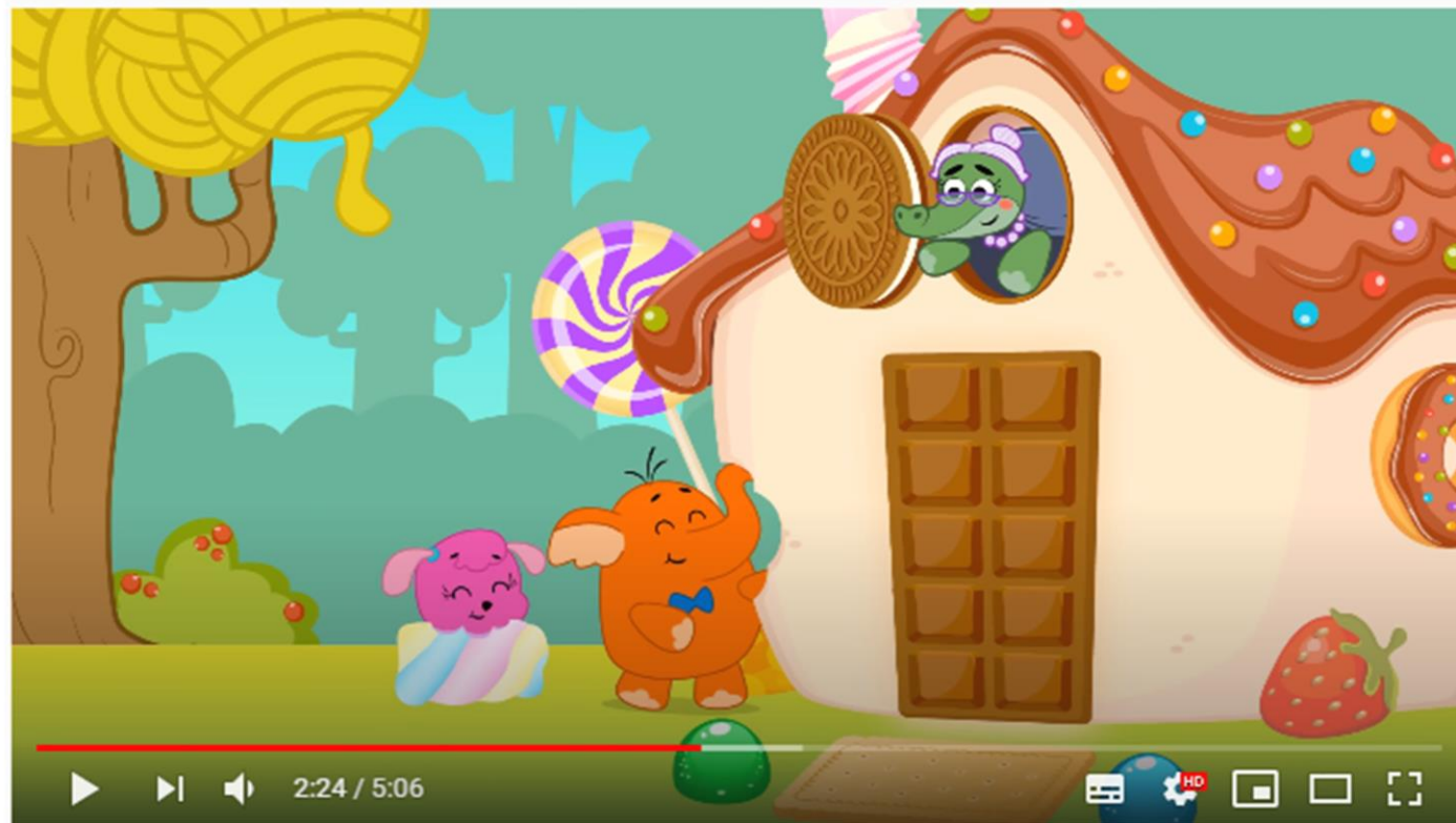
João e Maria Desenho Animado - A casa de Doces

Antes de iniciar a atividade, vamos assistir um desenho animado sobre a casa de doces?