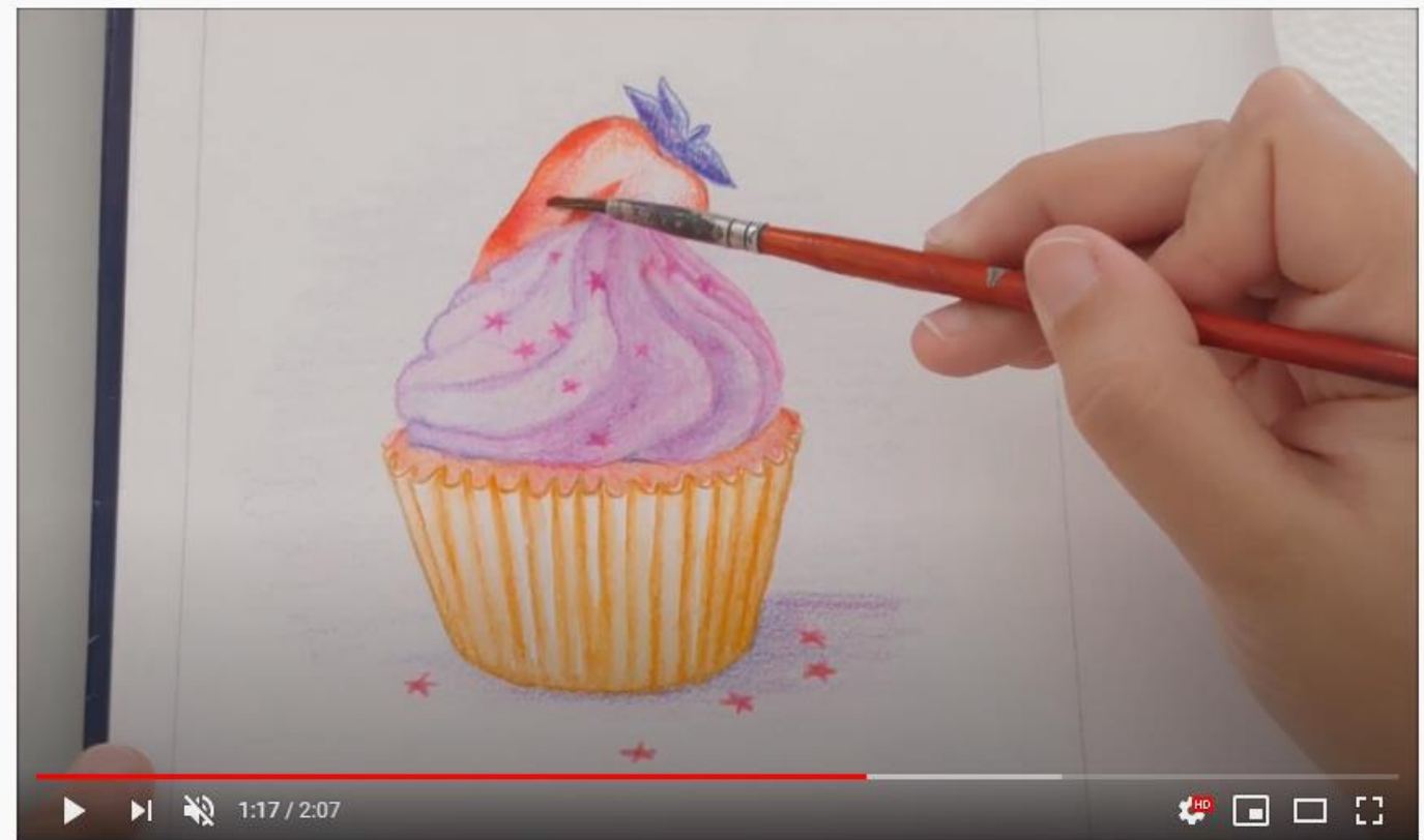
Cupcake com cores análogas