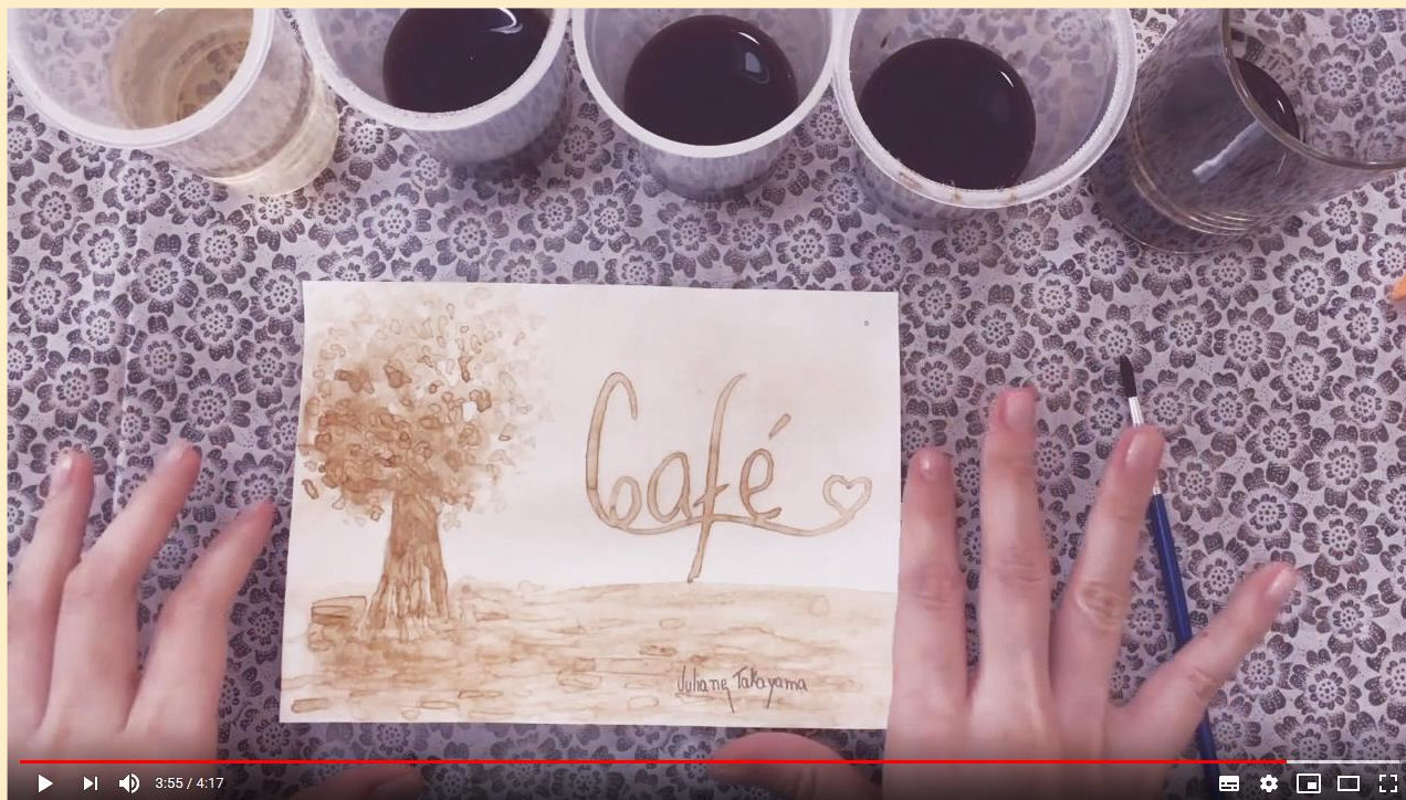
Pintura com pigmentos naturais - café

Assista ao vídeo abaixo e veja como eu fiz a pintura do meu trabalho usando o café.