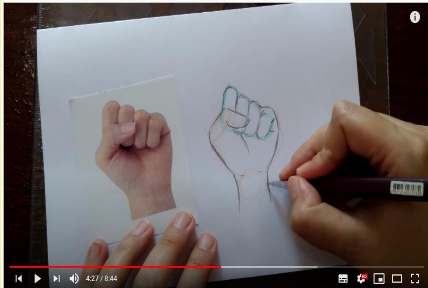
Como desenhar - Mão 1

https://www.youtube.com/watch?v=r-nV2Uowfgc&list=WL&index=74&t=8s