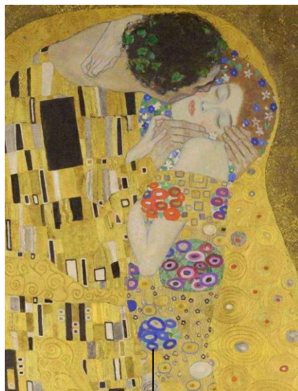
Obra que eu escolhi! O beijo, Klimt.

Na aula passada nos desafiamos a cobrir com colagem uma parte razoavelmente simples do nosso desenho (o ultimo plano nesse caso).