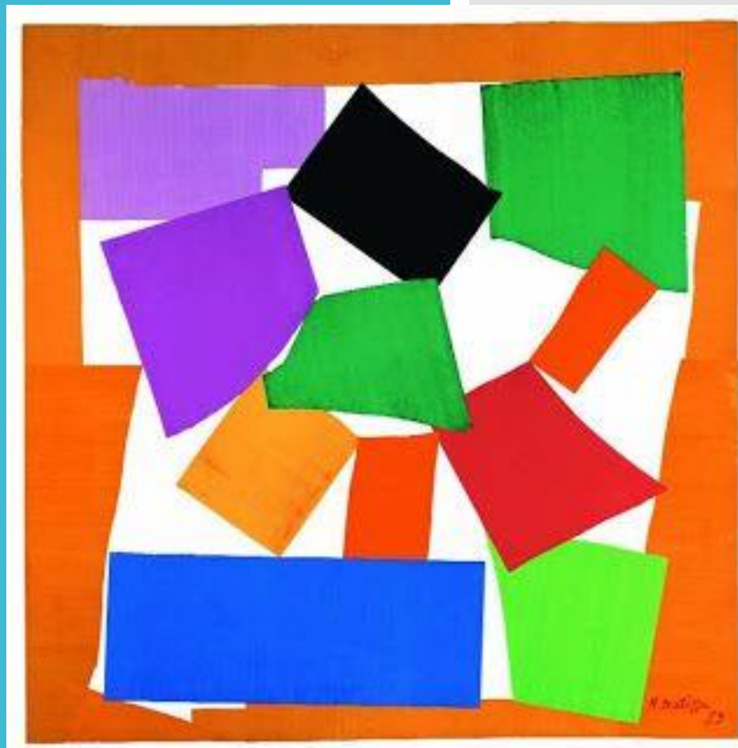
O Caracol, Henri Matisse