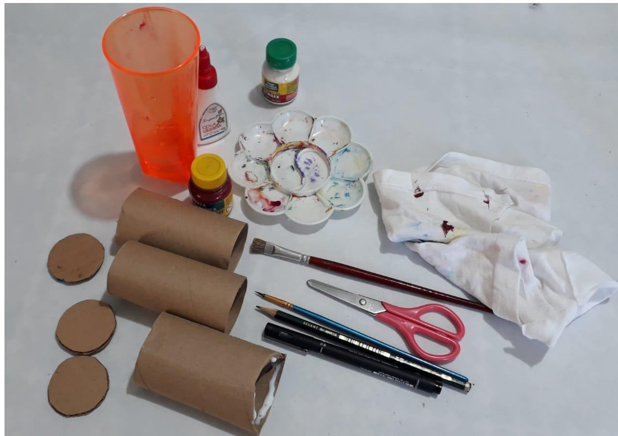
Foto dos materiais necessários