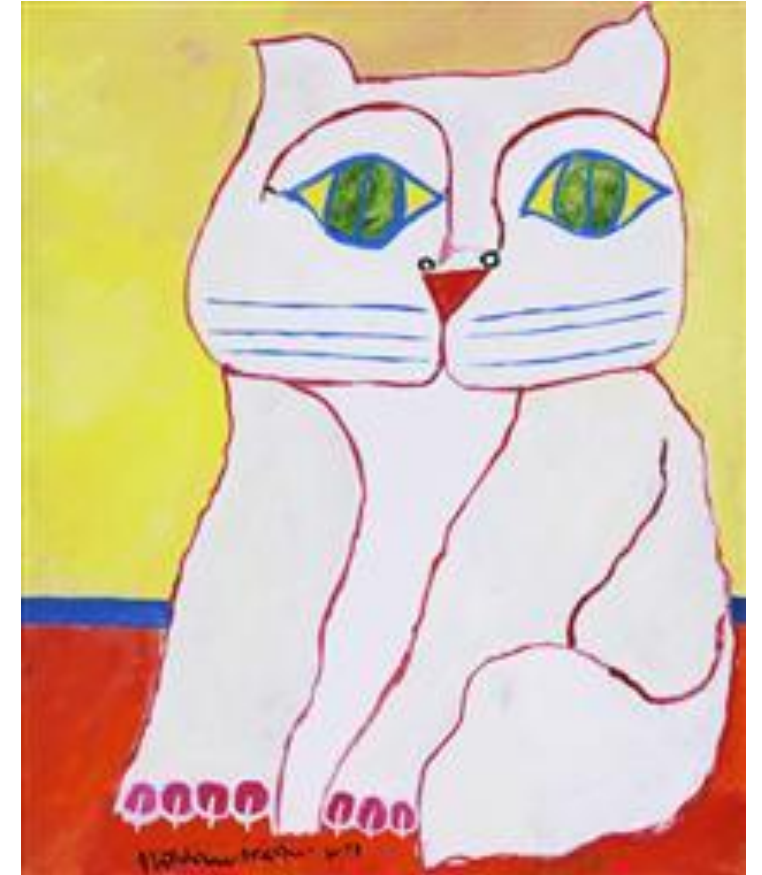
Gato branco, 2001