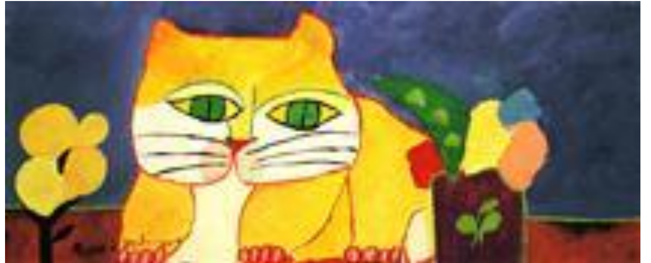
Gato amarelo, 2001