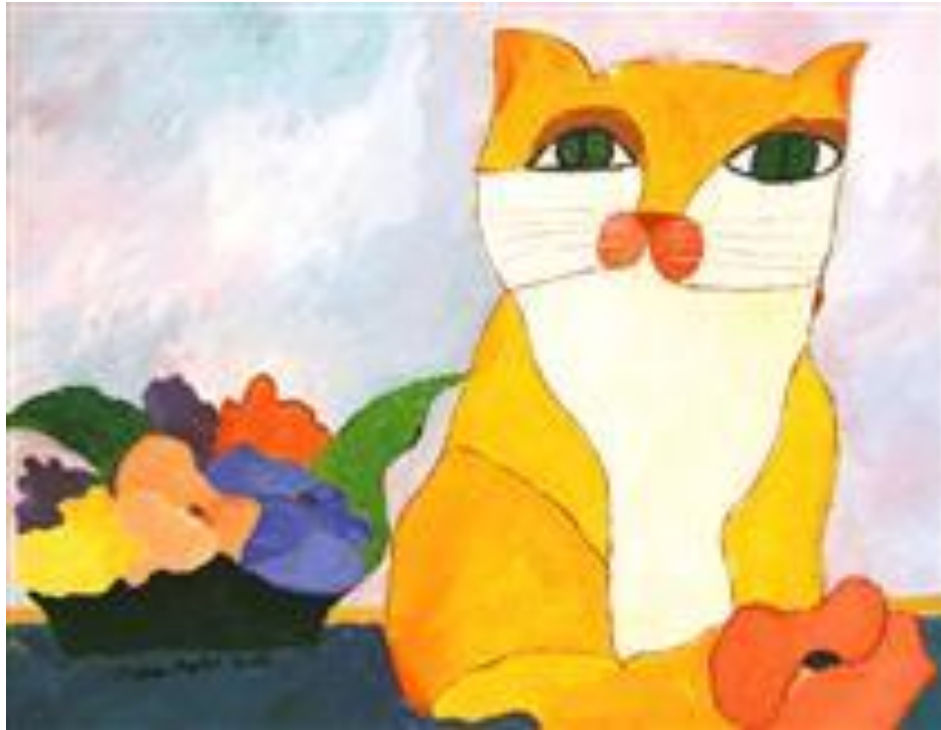
Flores e gato amarelo, 2002