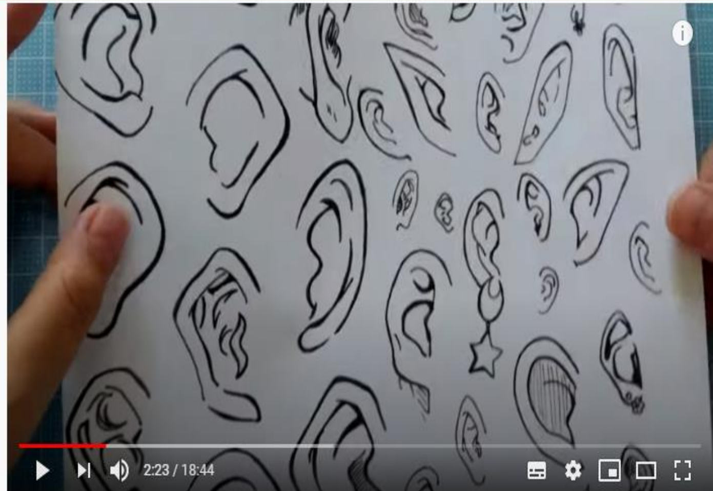
Como desenhar Orelhas

https://www.youtube.com/watch?v=juUMd5fH47Q&t=1s