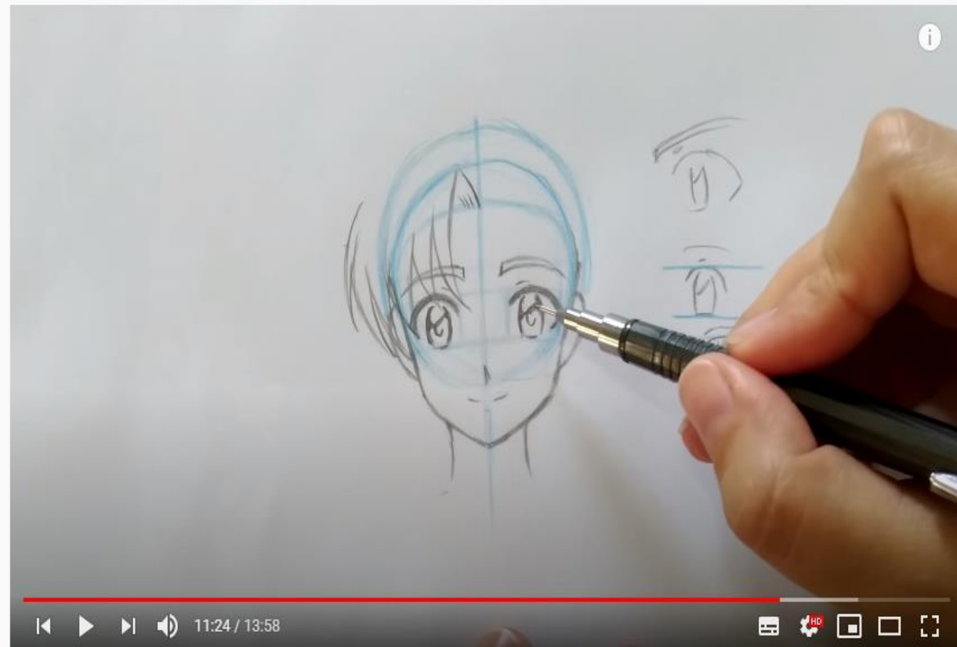
Como desenhar Mangá - Rosto de frente

https://www.youtube.com/watch?v=_qIJhgBTch4&list=WL&index=31&t=4s