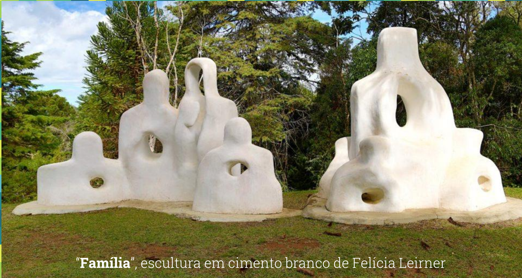
“Família” , escultura em cimento branco de Felícia Leirner