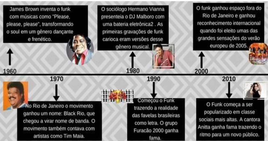
LINHA DO TEMPO DO FUNK

As linhas do tempo podem servir para mostrar a evolução de qualquer objeto e fontes históricas. Portanto, a linha do tempo mostra as mudanças de um determinado objeto, personagem ou ação humana!