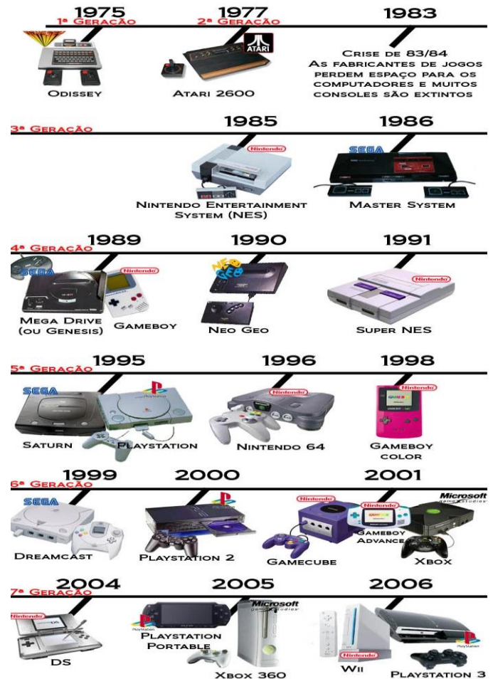
LINHA DO TEMPO DOS VÍDEO GAMES