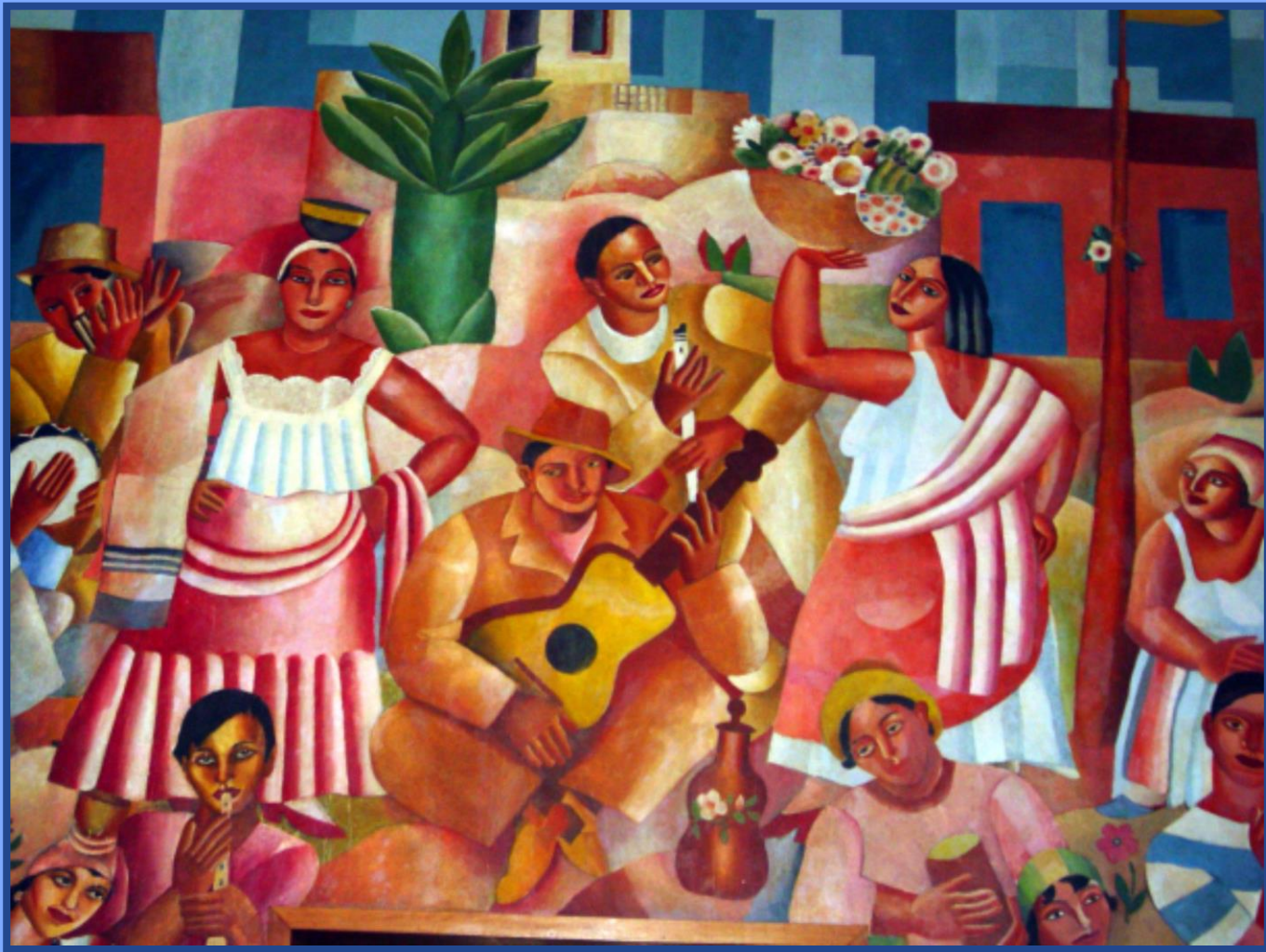
Baile Popular (1972) Di Cavalcanti