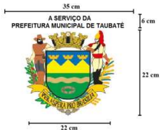
Plotagem de Identificação do Veículo – Figura 2: