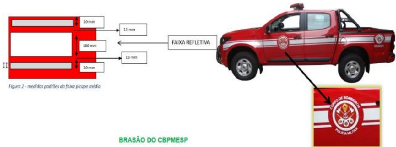
Figura 2 - medidas padrões da faixa picape médio