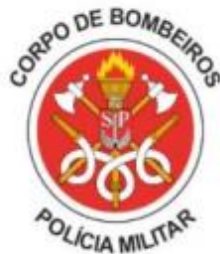
Imagem: brasão CBPMESP