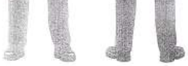
Camisa com gola e malha polo.