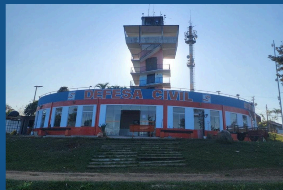
BASE DA DEFESA CIVIL