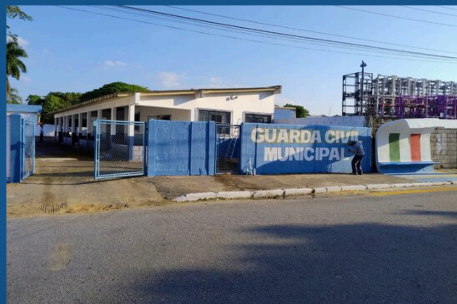
BASE DO QUIRIRIM