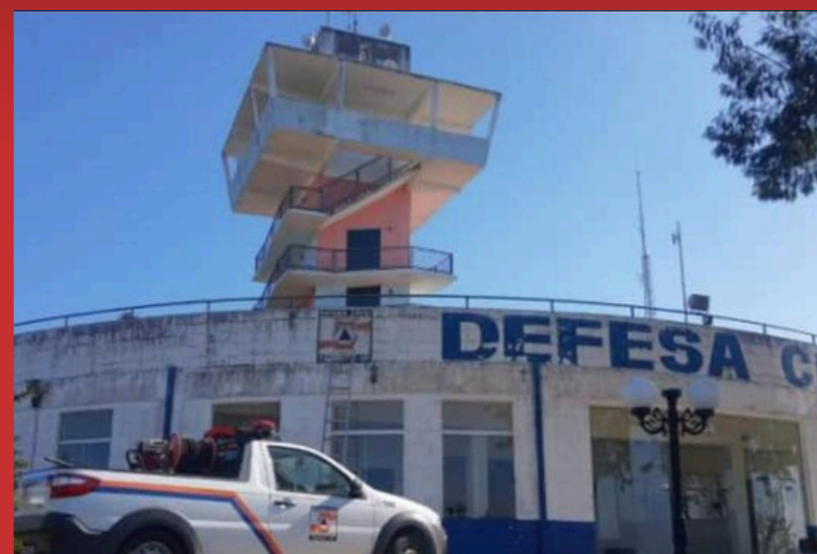
BASE DA DEFESA CIVIL