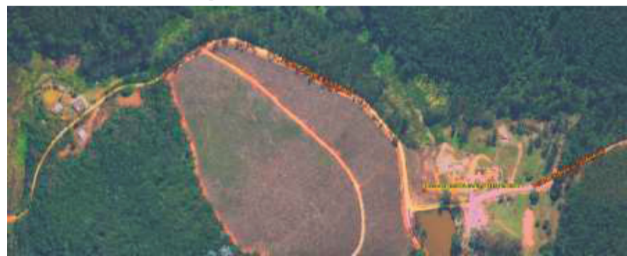
ROTA COMPLETA TIRADA DO GOOGLE MAPS

Deste segue até o ponto PMT-V-0009 definido pelas coordenadas UTM X=468335.8570 e Y=7448156.3013. Este é o ponto final da rota.